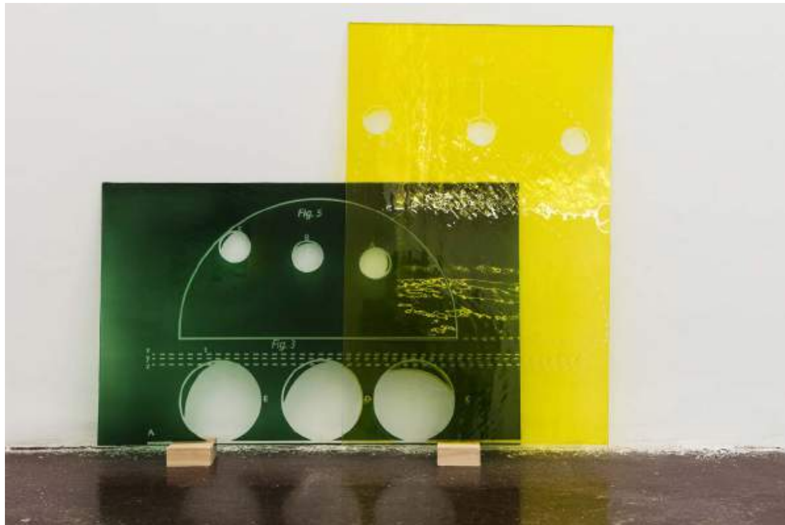
NF/ Laura F. Gibellini Tránsito 2017 Cristal soplado y grabado al ácido 50 x 80 cm c/u [díptico]