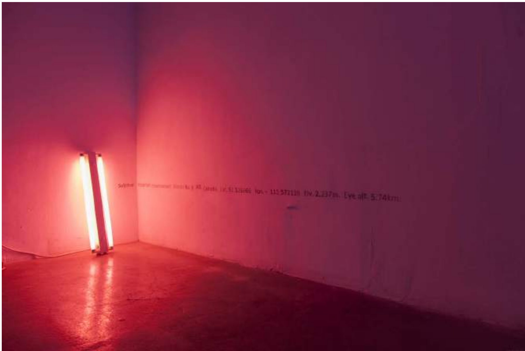
NF / DRAWING MOUNTAINS 2019 Vista de instalación espositivo, Madrid