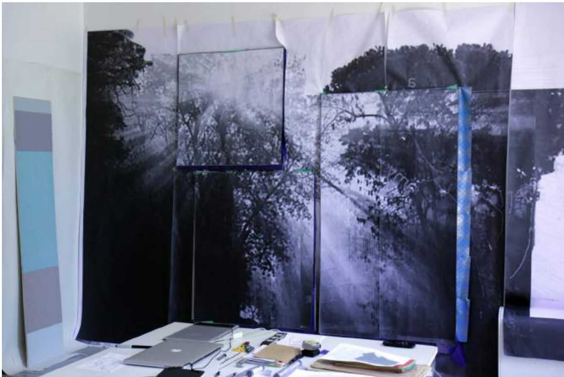
NF/ Residencia en la Real Academia de España en Roma (RAER) 2018 Vista de estudio Real Academia de España, Roma