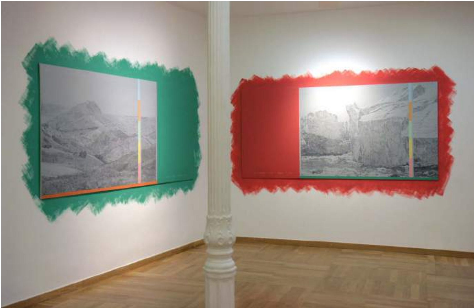
NF / MEDITACIONES ATMOSFÉRICAS. ANTES DEL PRESENTE (603-7465 U) 2017 Vista de instalación Slowtrack, Madrid