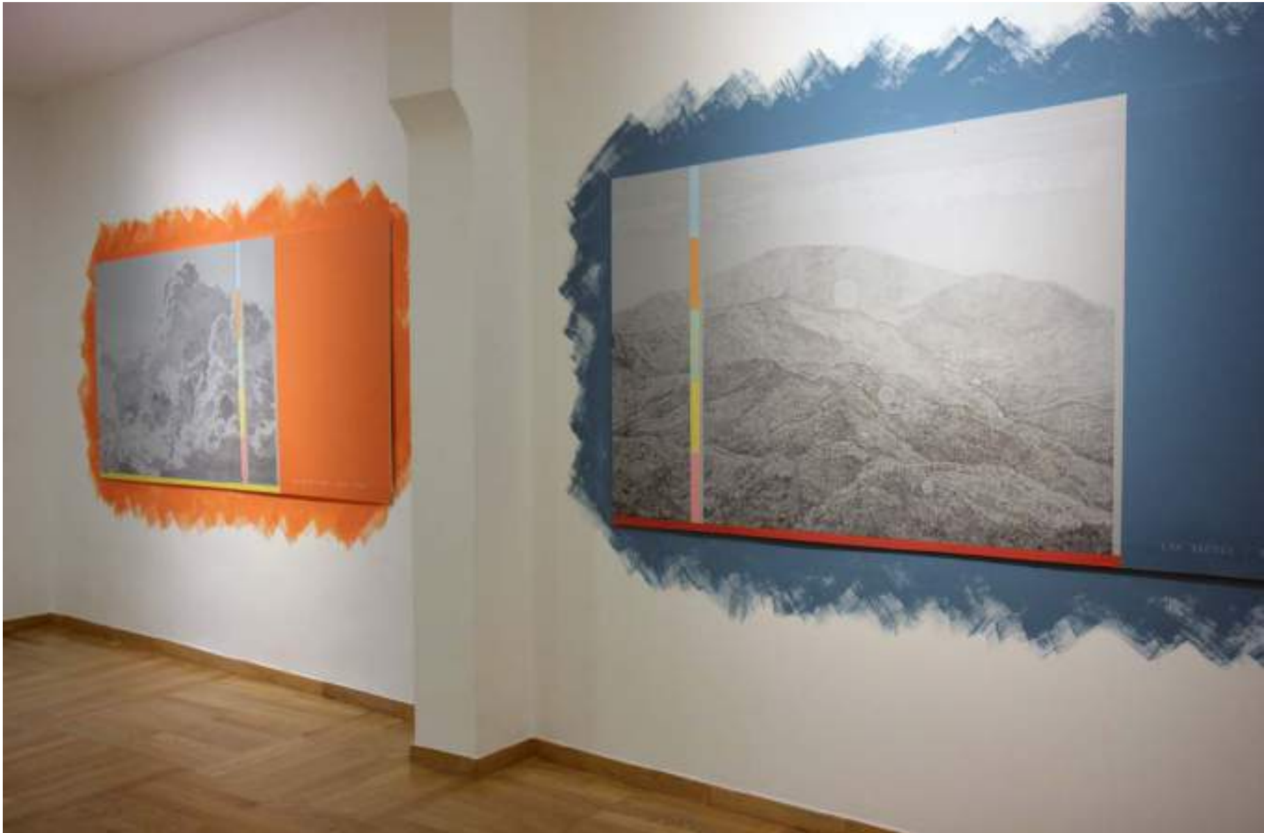
NF/ MEDITACIONES ATMOSFÉRICAS. ANTES DEL PRESENTE (603-7465 U) 2017 Vista de instalación Slowtrack, Madrid