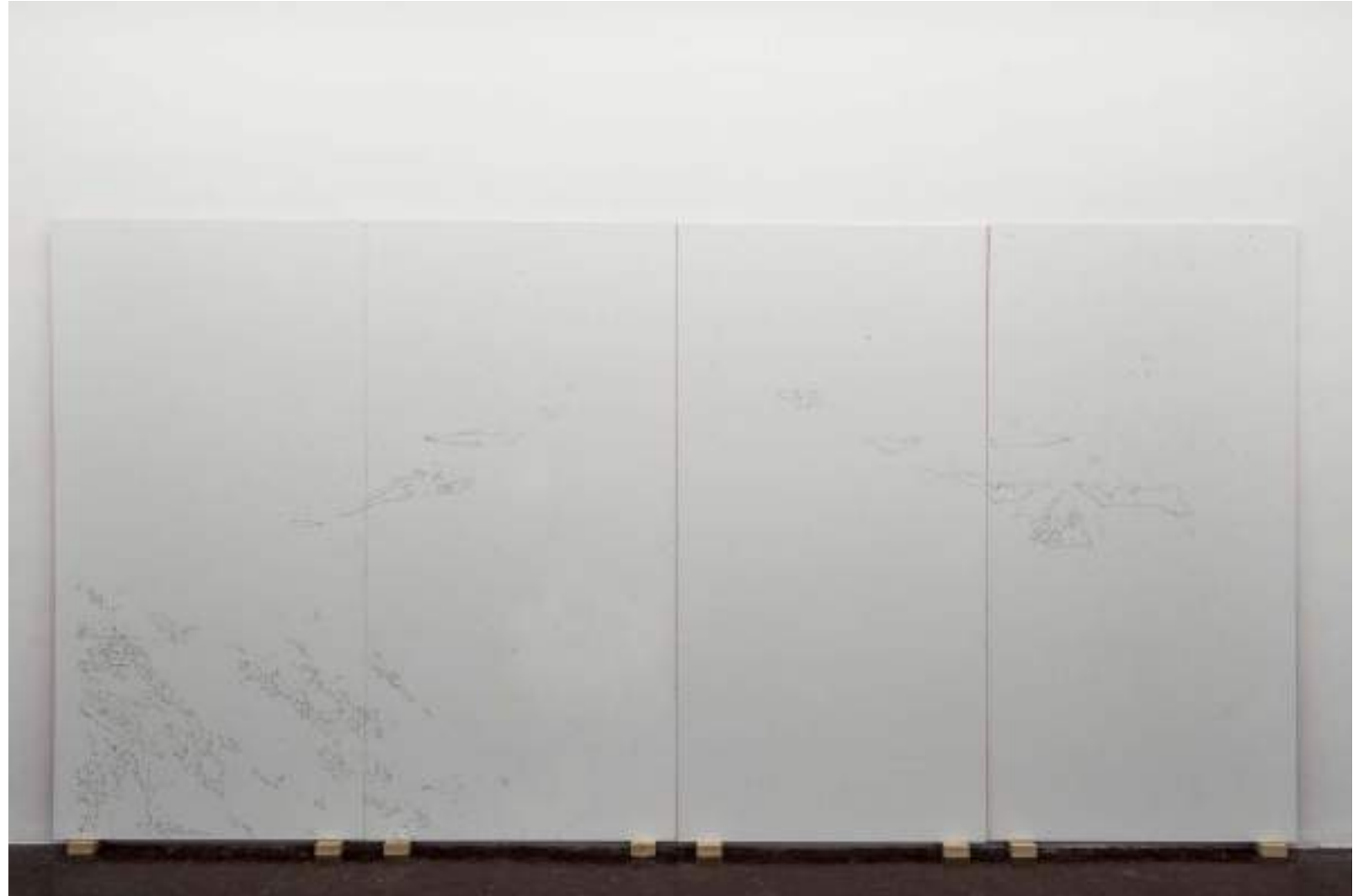
NF/ Laura F. Gibellini Drawing a Mountain 2020-21 Óleo en barra sobre cartón pluma 200 x 420 cm