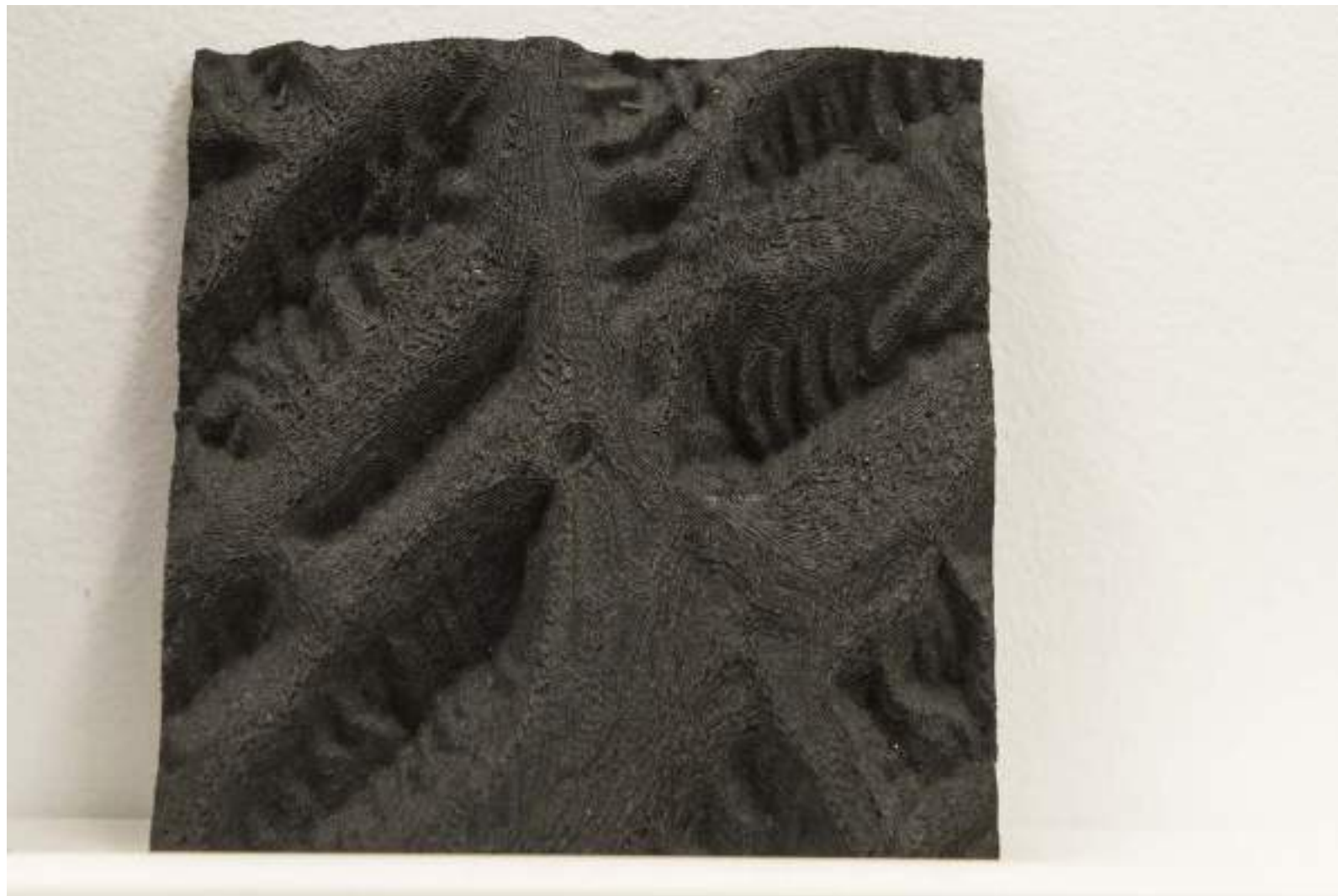
NF/ Laura F. Gibellini Boundary of (In)visible Ice 2017 Polímero extruido 11 x 11 x 2,5 cm