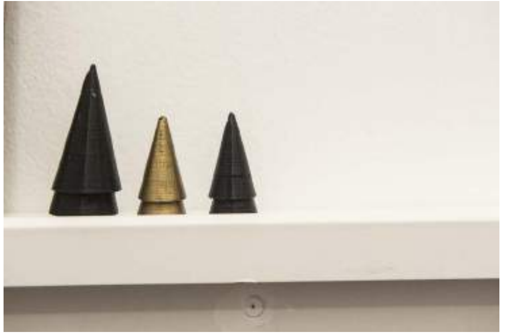
NF / Laura F. Gibellini Key to the Invisible Ice 2017 Polímero extruido Medidas variables