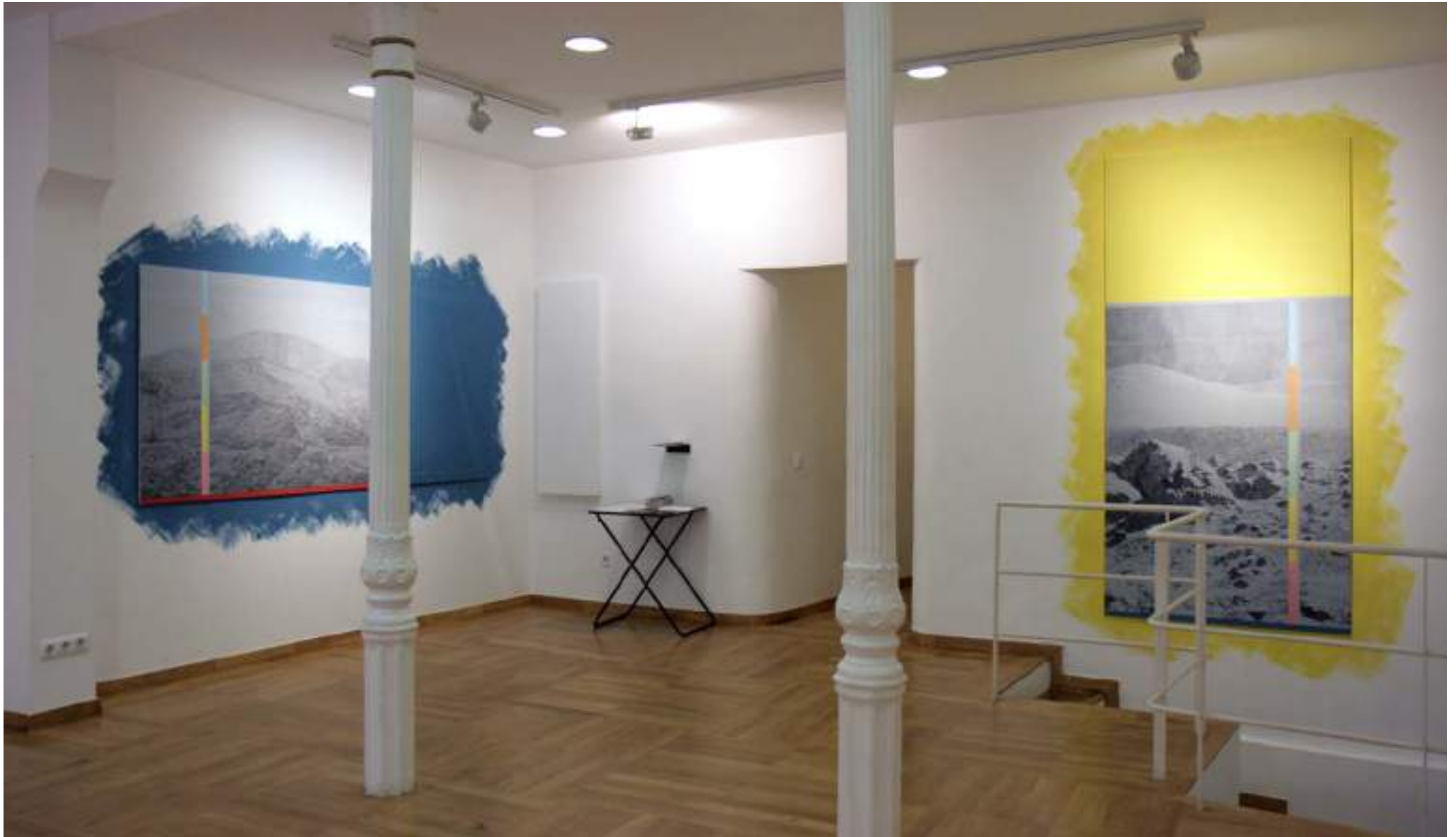
NF / MEDITACIONES ATMOSFÉRICAS. ANTES DEL PRESENTE (603-7465 U) 2017 Vista de instalación Slowtrack, Madrid