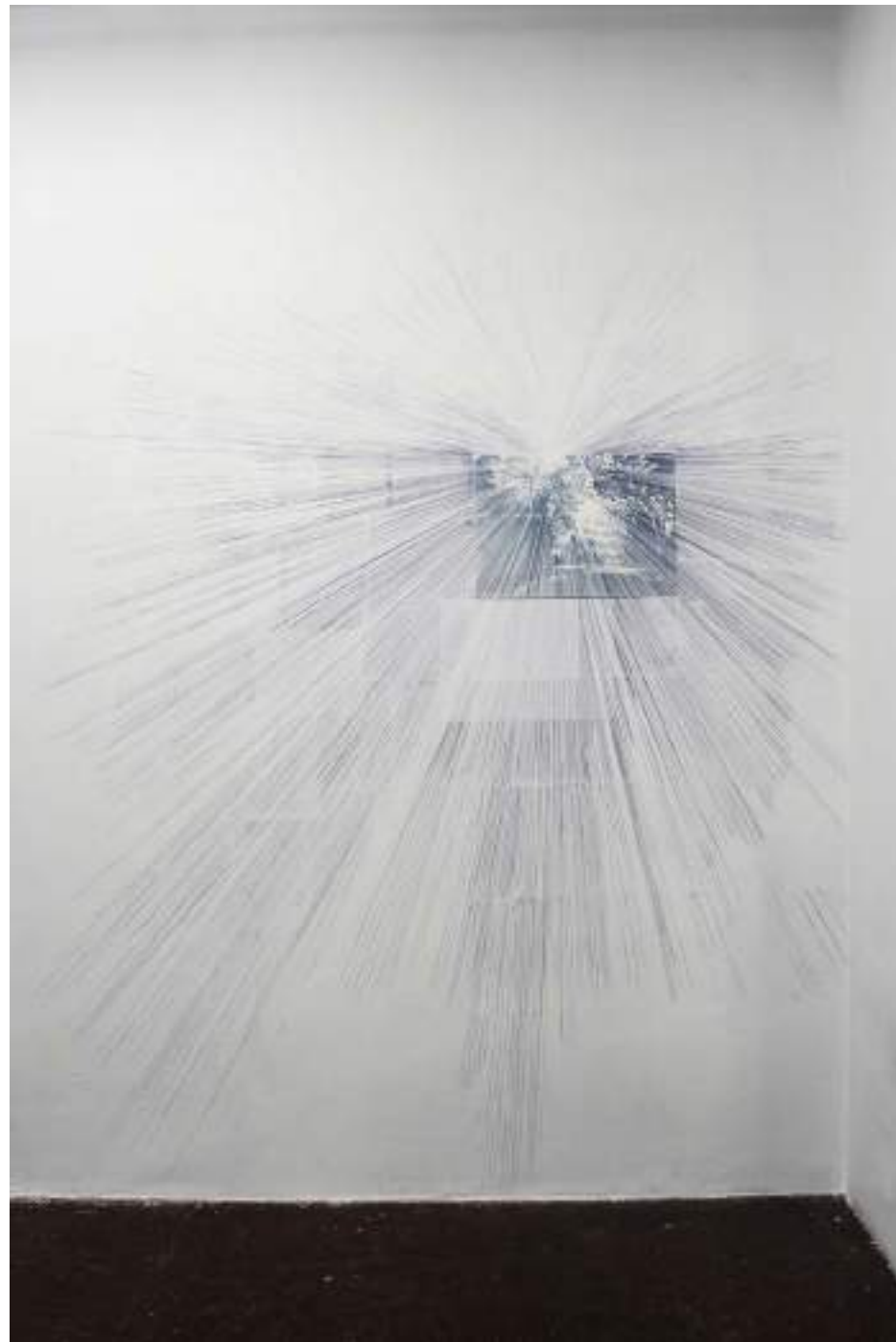
NF/ Laura F. Gibellini Estudio 1 2017 Dibujo sobre papel y pared Medidas variables