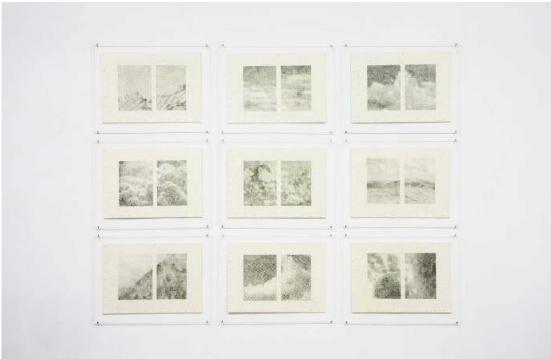
NF/ Laura F. Gibellini Cumulus Panorama 2013 Grafito sobre papel 21 x 29,7 cm [Serie de nueve dípticos]