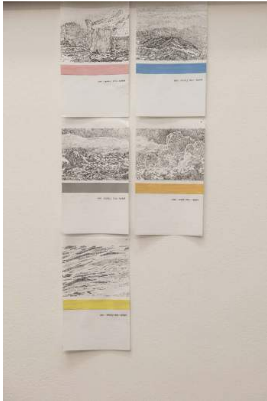
NF/ Laura F. Gibellini Colores del mundo 2016 Grafito y gouache sobre papel 21 x 13 cm c/u [serie de 6 dibujos]