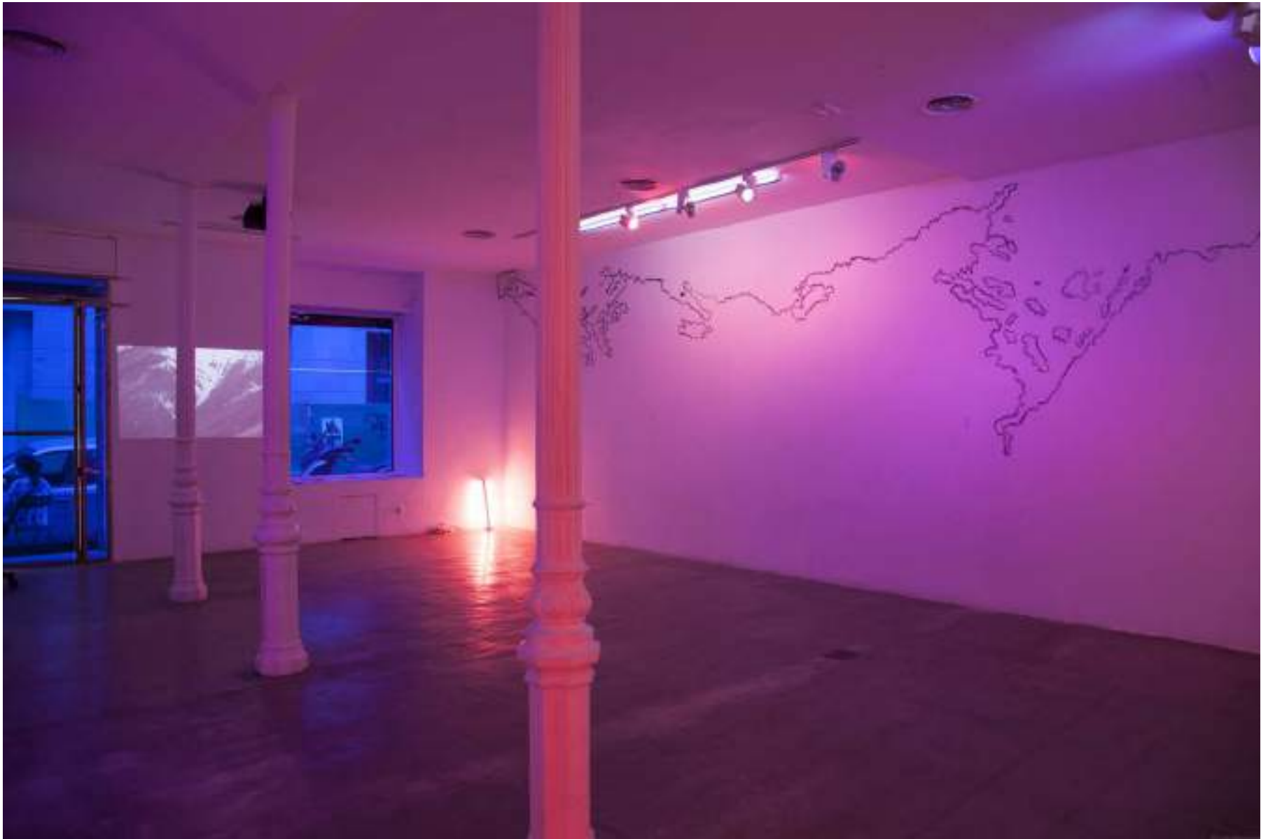
NF / DRAWING MOUNTAINS 2019 Vista de instalación espositivo, Madrid