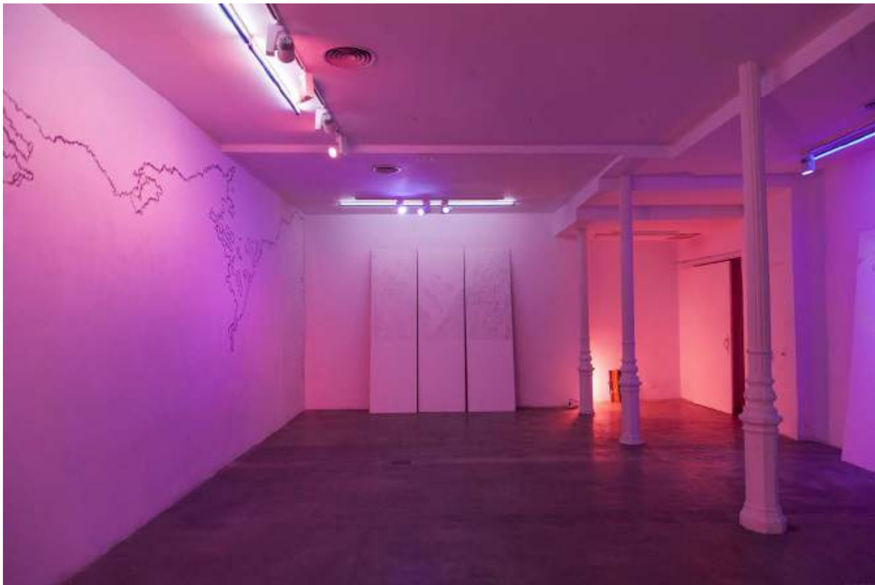
NF/ DRAWING MOUNTAINS 2019 Vista de instalación espositivo, Madrid