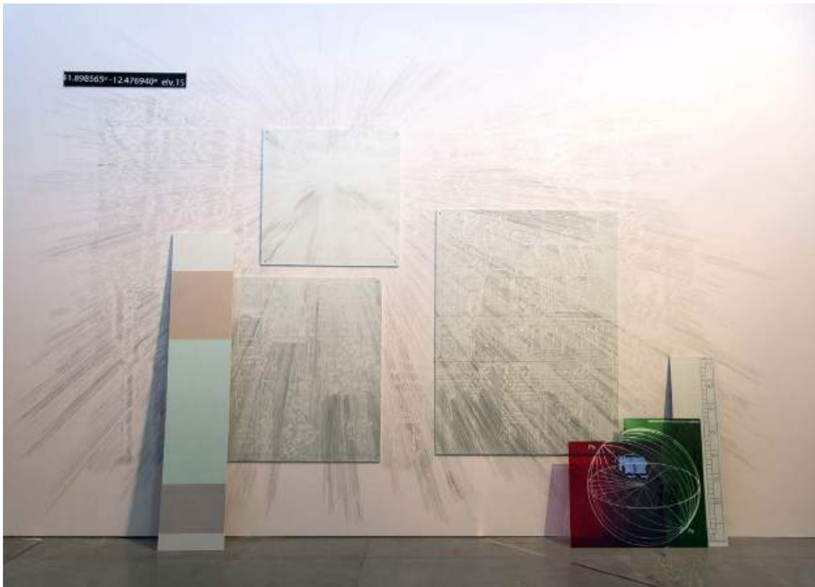
NF/ Processi 144_M, entrelazarse con Roma 2018 Vista de instalación Matadero, Madrid