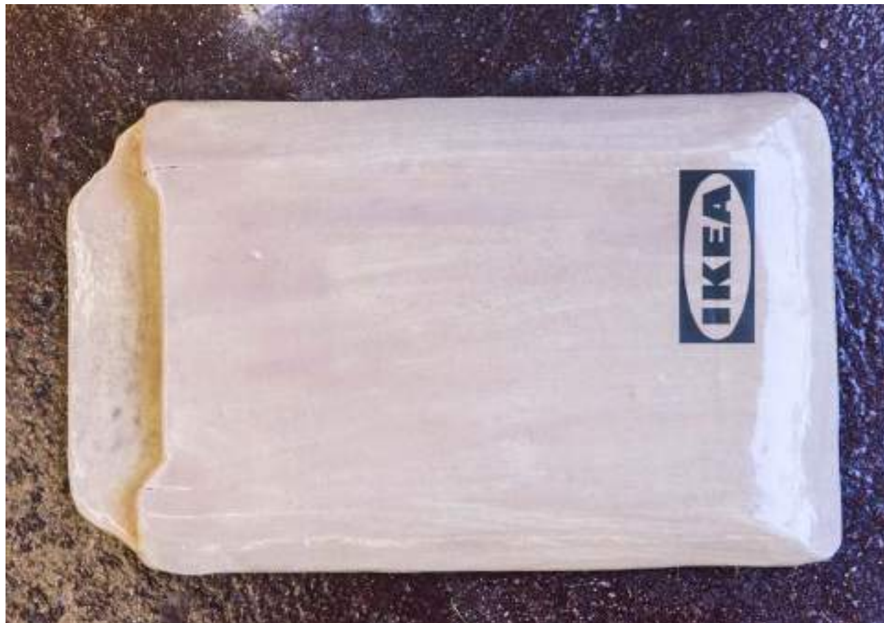
NF / Tamara Arroyo Caja de IKEA 2019 Cerámica esmaltada 3 x 30 x 19 cm