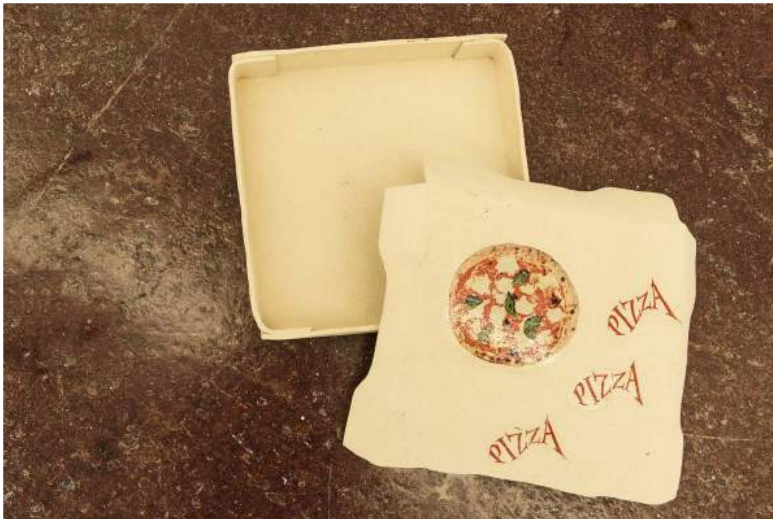
NF / Tamara Arroyo Caja de pizza I 2019 Cerámica y collage 8 x 64 x 40 cm