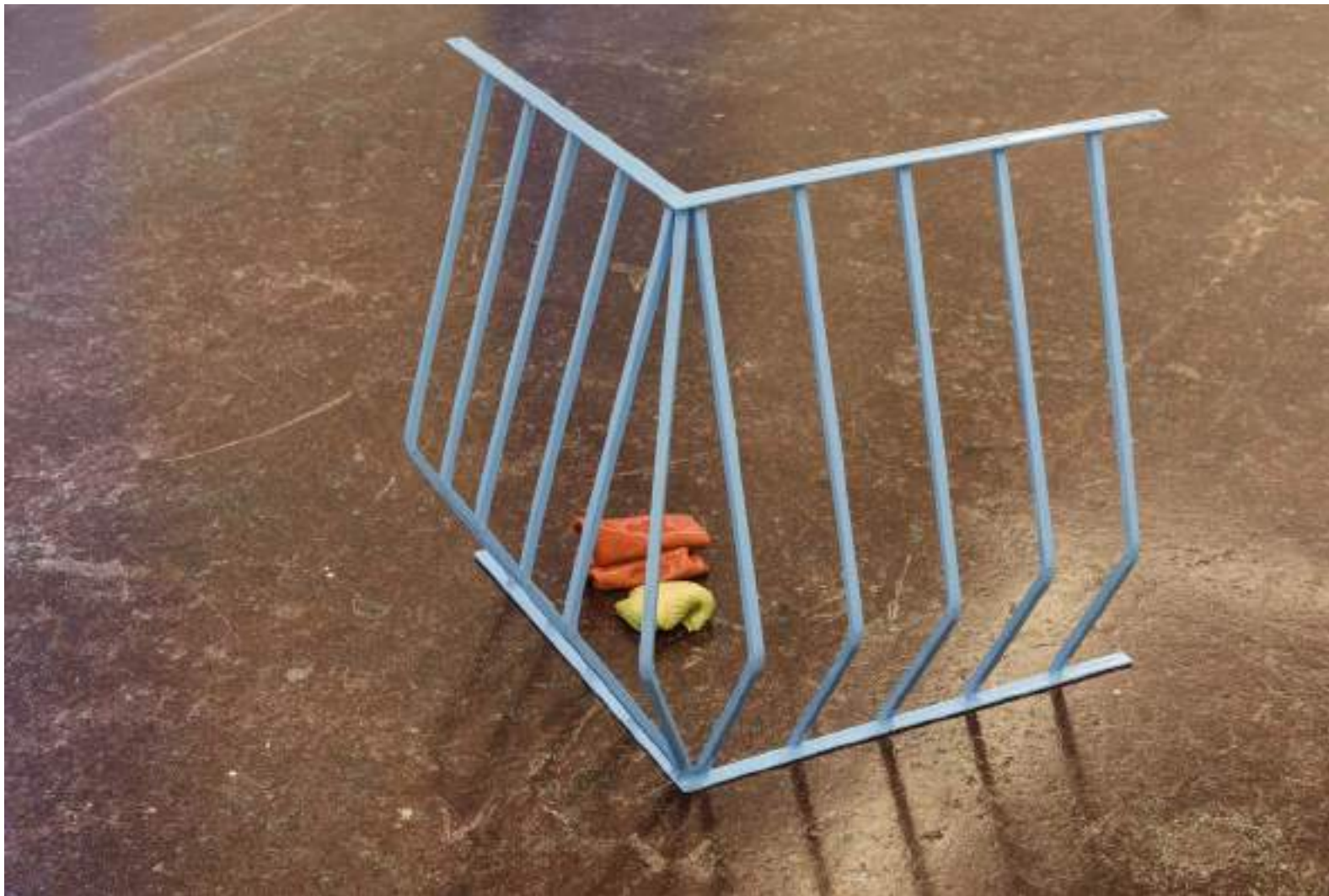
NF / Tamara Arroyo Balcón (Azul) 2019 Esmalte sobre metal 56 x 68,5 x 54 cm