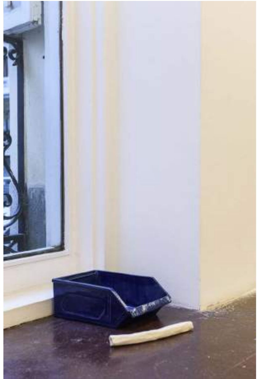
NF / Tamara Arroyo Caja de herramientas 2019 Cerámica esmaltada 12 x 30 x 22 cm