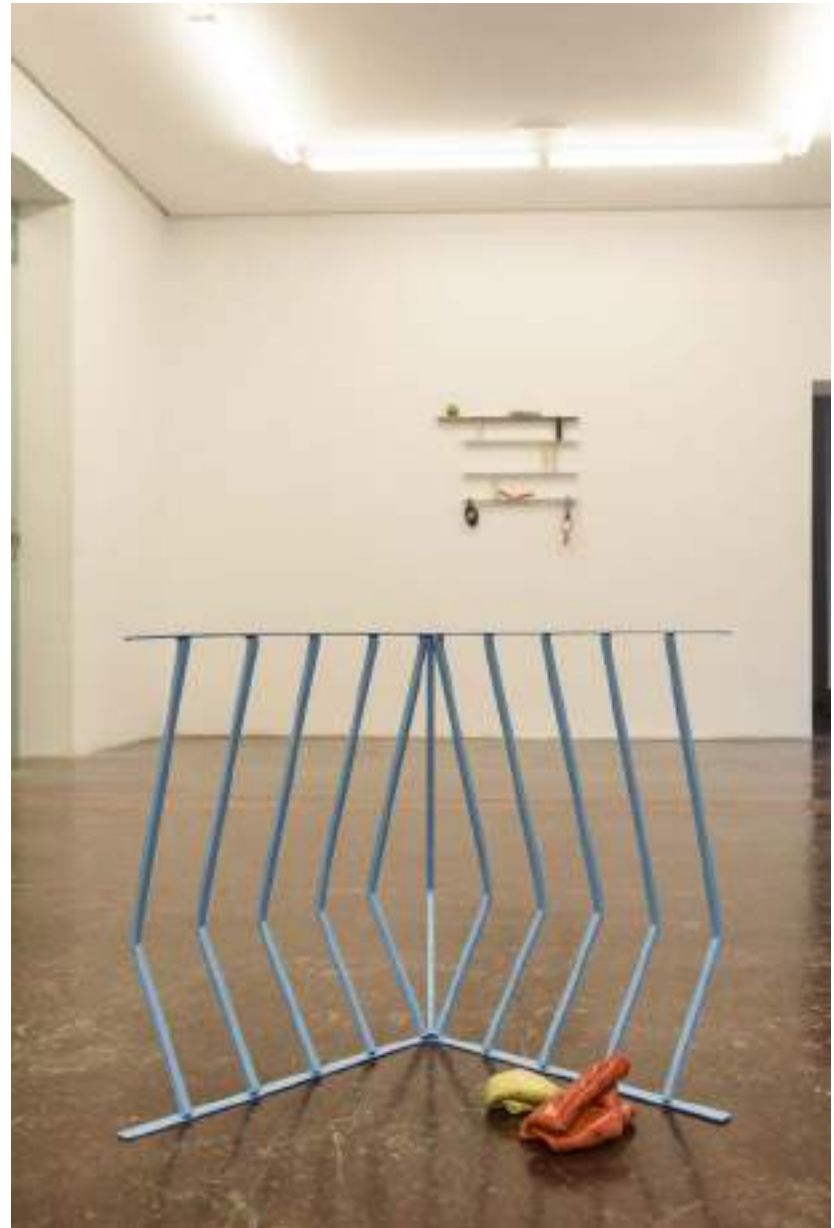
NF / Tamara Arroyo Balcón (Azul) 2019 Esmalte sobre metal 56 x 68,5 x 54 cm