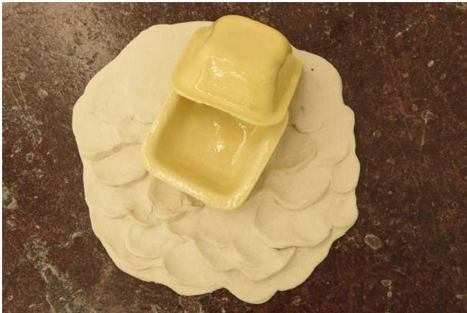
NF/ Tamara Arroyo Mancha de hamburguesa 2019 Cerámica y cerámica esmaltada 10 x 35 x 35 cm