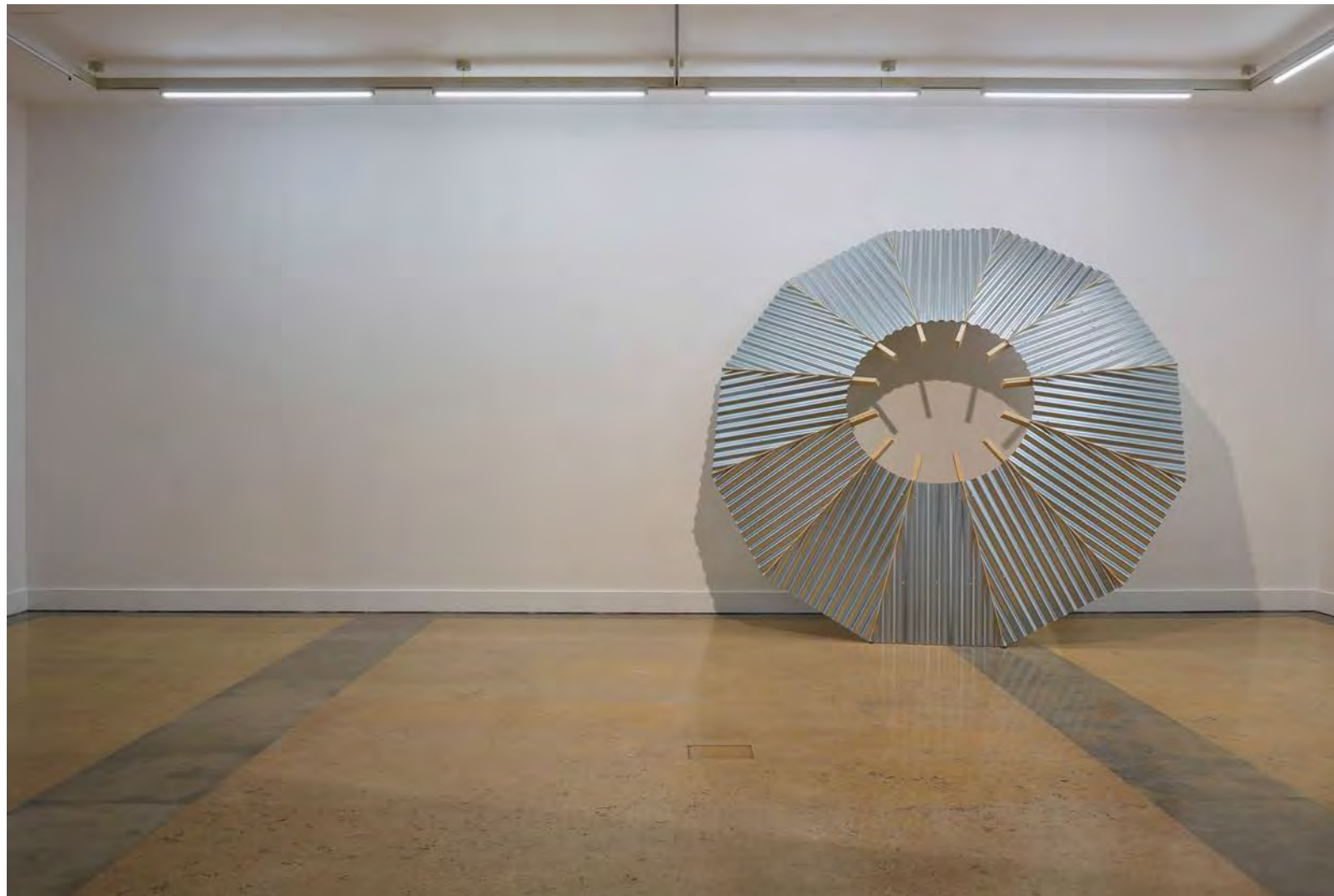
NF / Ângela Ferreira Dalaba: Sol d'Exil Telhado 2019 Pine and wavy zinc plate ø 345,8 x 48,4 cm