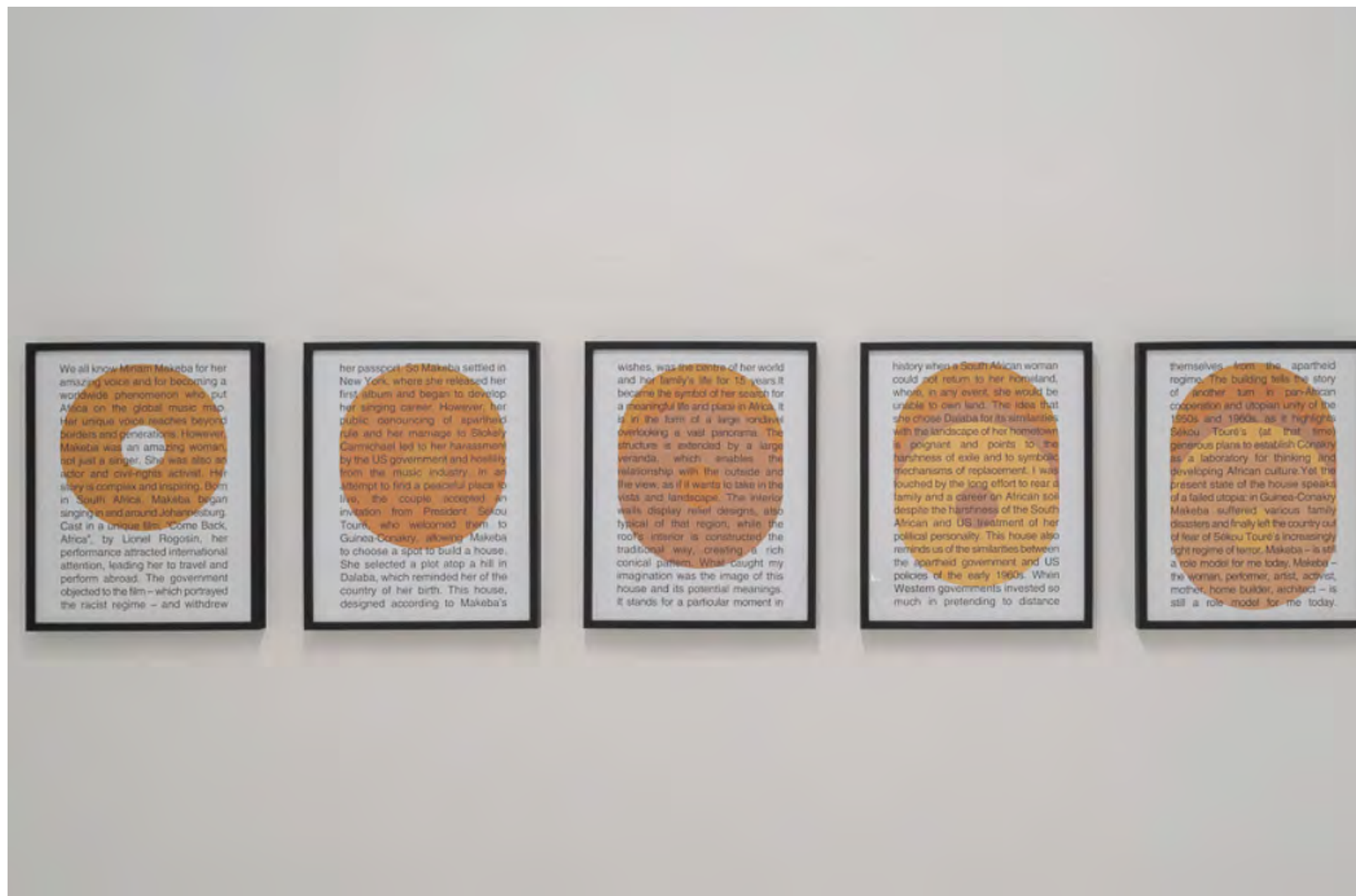
NF / Ángela Ferreira Dalaba: Sol d'Exil 5 Posters 2019 Xerox on paper 60 x 40 cm each