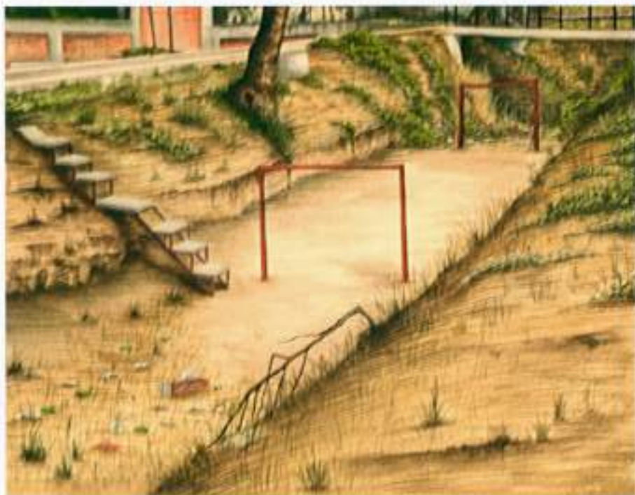
Moris [Israel Meza Moreno]