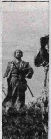
Els set sa

Duran l'edifici d a metàfor plicar-se, kure, que gakure, i Mishima any, desq «Un sa nor fatig seva tasc