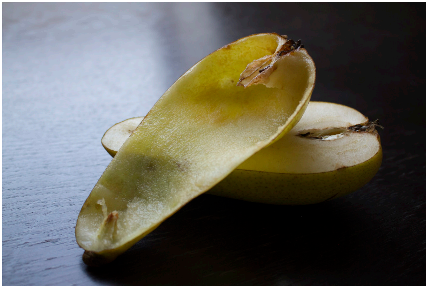
Pera 2023 Digital print. Ed 1/3+AP 60 x 100 cm