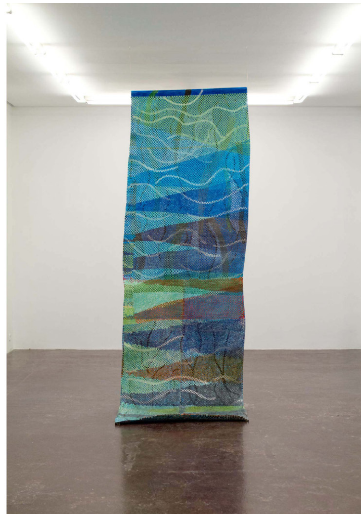
Dibujo tejido, 8 2021 Coloured pencil on paper 400 x 100 cm