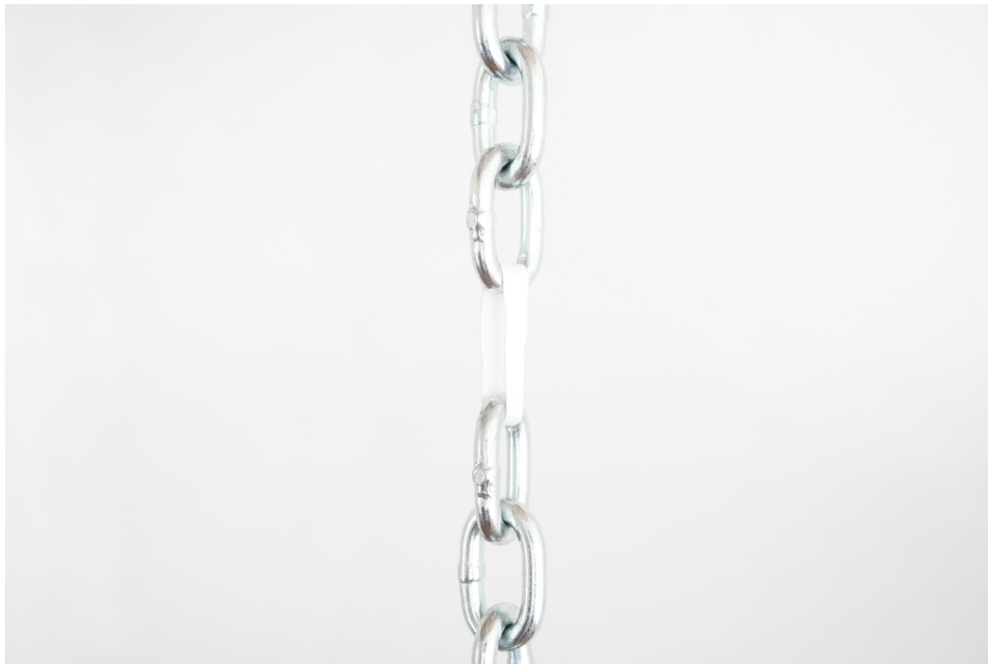
Papel metal 2022 Metal chain, paper 302 x 2 x 2 cm