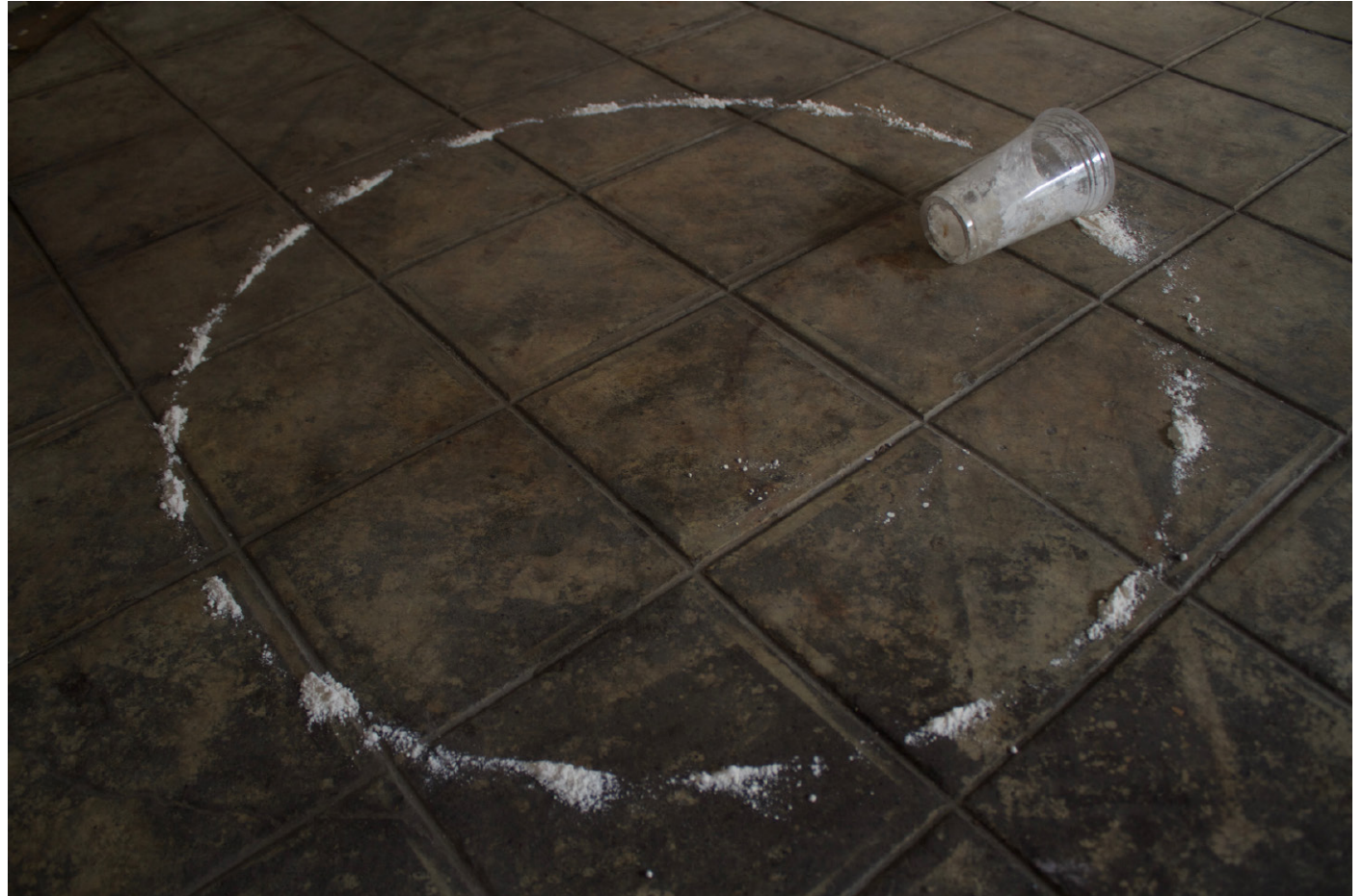
Ensayo sobre circunferencia 16 2023 Glass, flour Variable dimensions