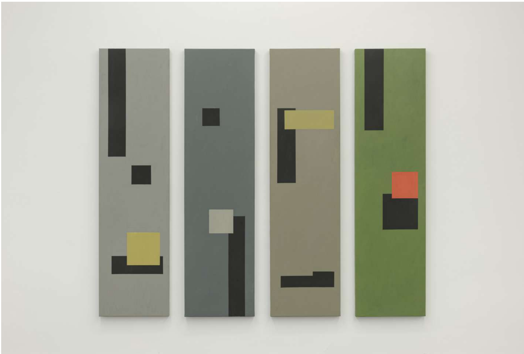
NF/ Untitled 1612 2023 Oil on canvas Polyptych. 180 x 47 cm each piece