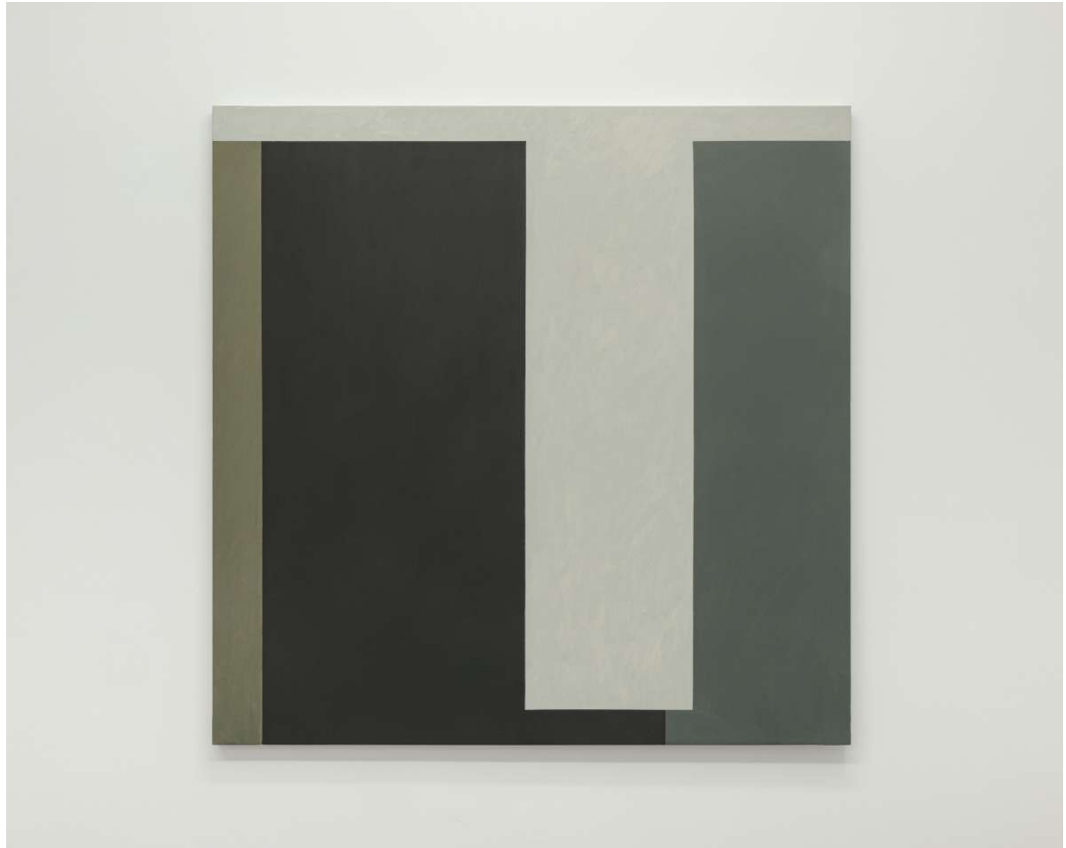
NF / Canova / Venecia 2023 Óleo sobre lienzo 160 x 160 cm