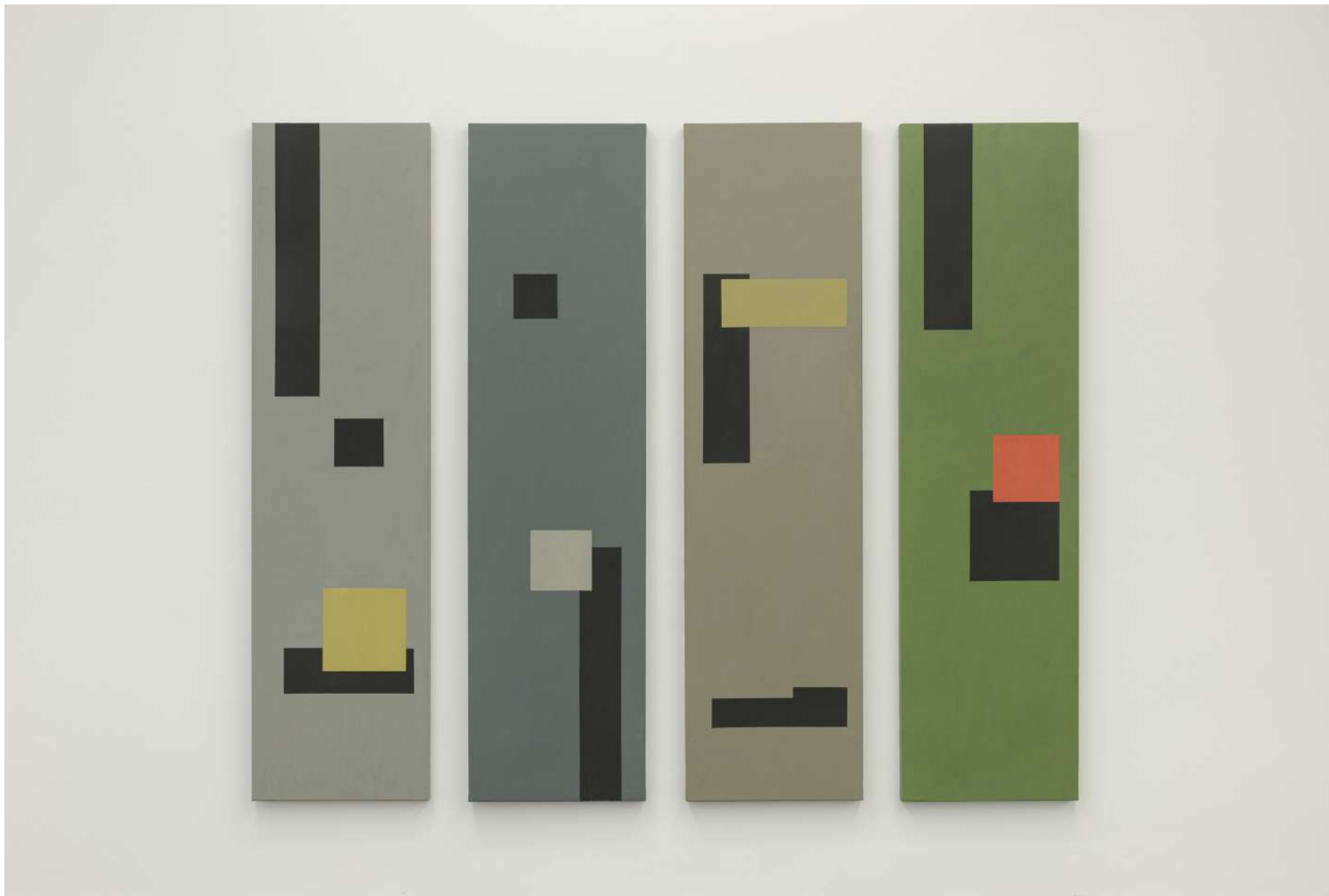
NF/ Sin título 1612 2023 Óleo sobre lienzo Políptico. 180 x 47 cm cada pieza