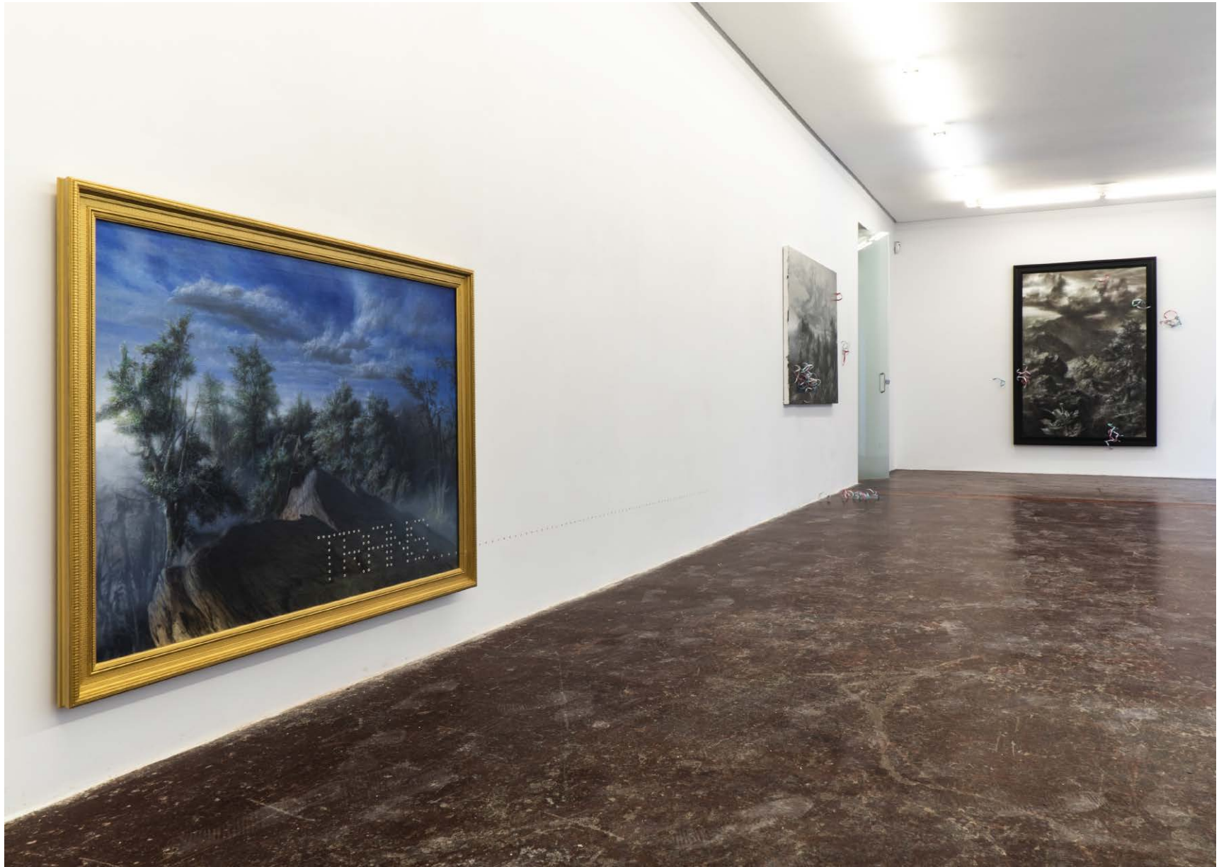
NF/ Pipo Hernández Rivero A dos pasos Vista de exposición