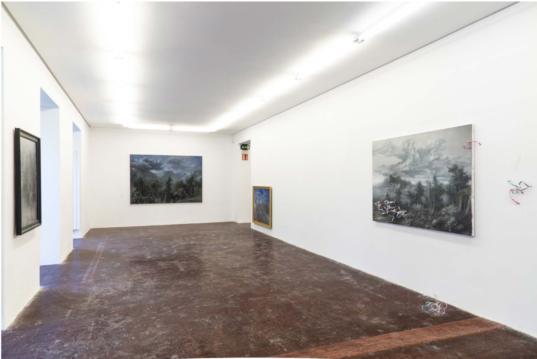
NF/ Pipo Hernández Rivero A dos pasos Vista de exposición