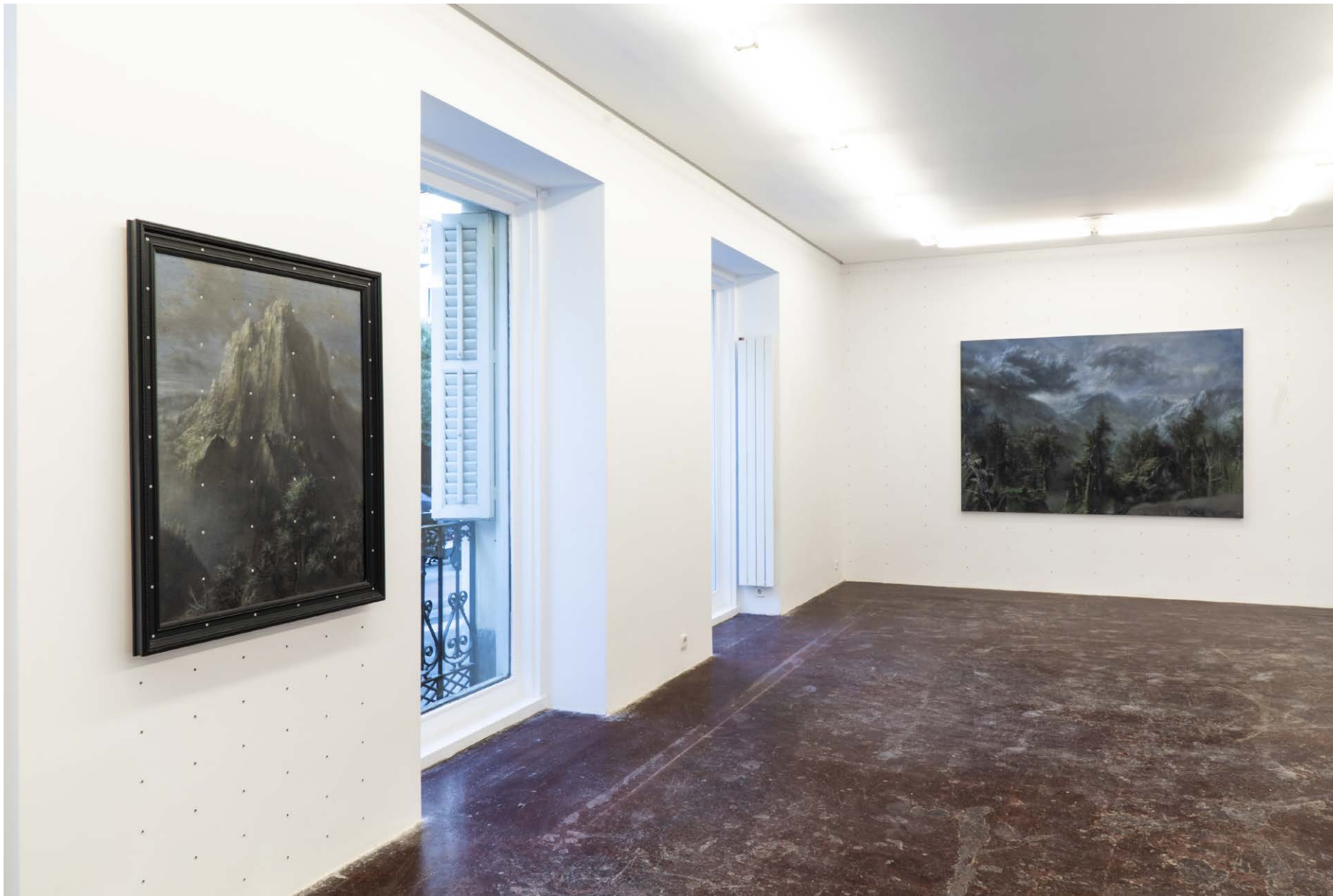
NF/ Pipo Hernández Rivero A dos pasos Vista de exposición